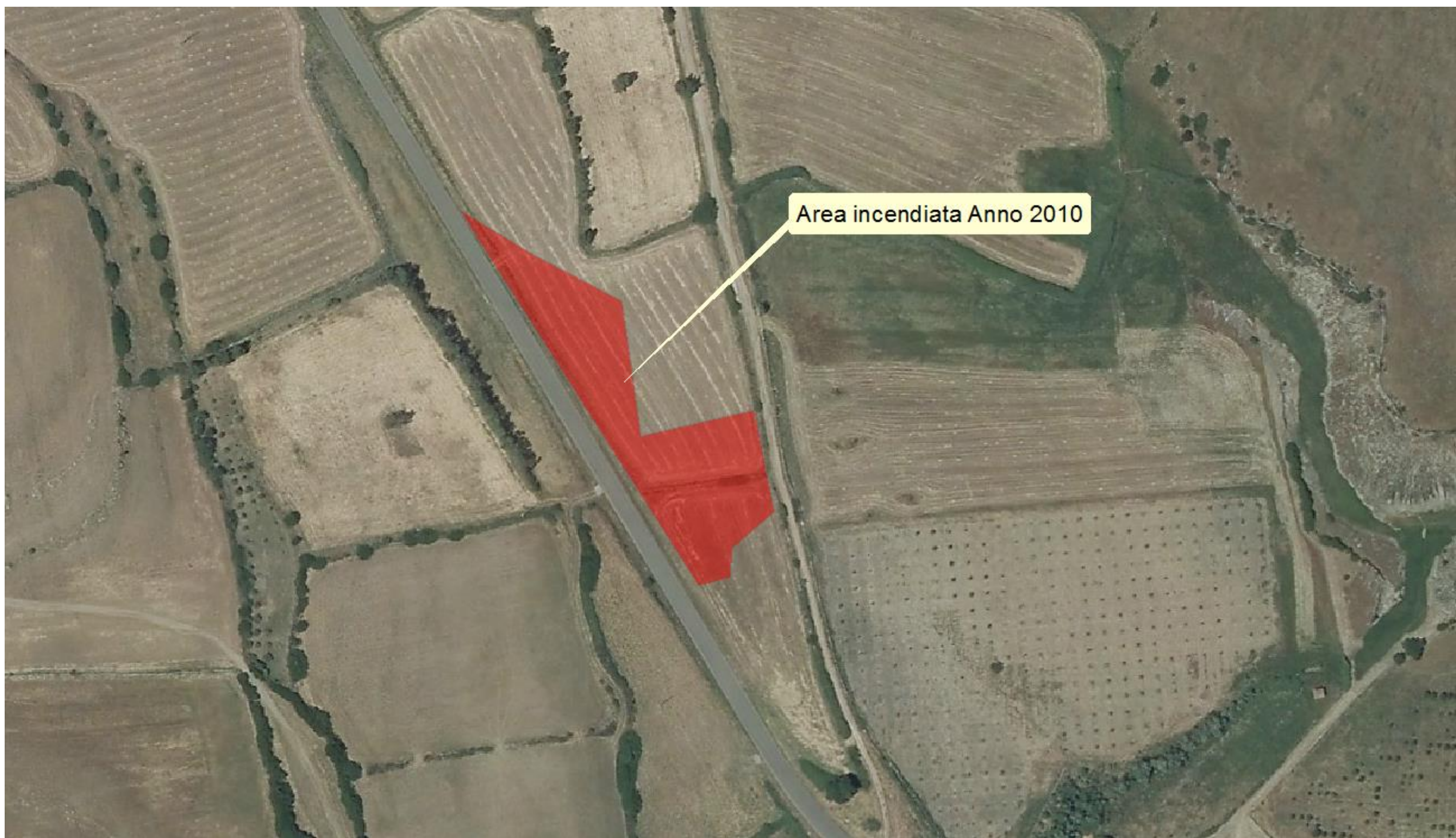
Figure 1: area incendiata su ortofoto 2013 – da rilevamento CFVA