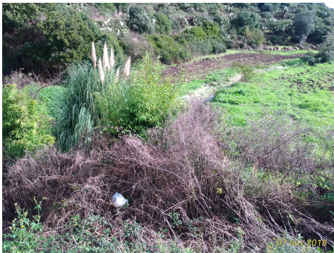
Foto 3 Rio Funtana Bella