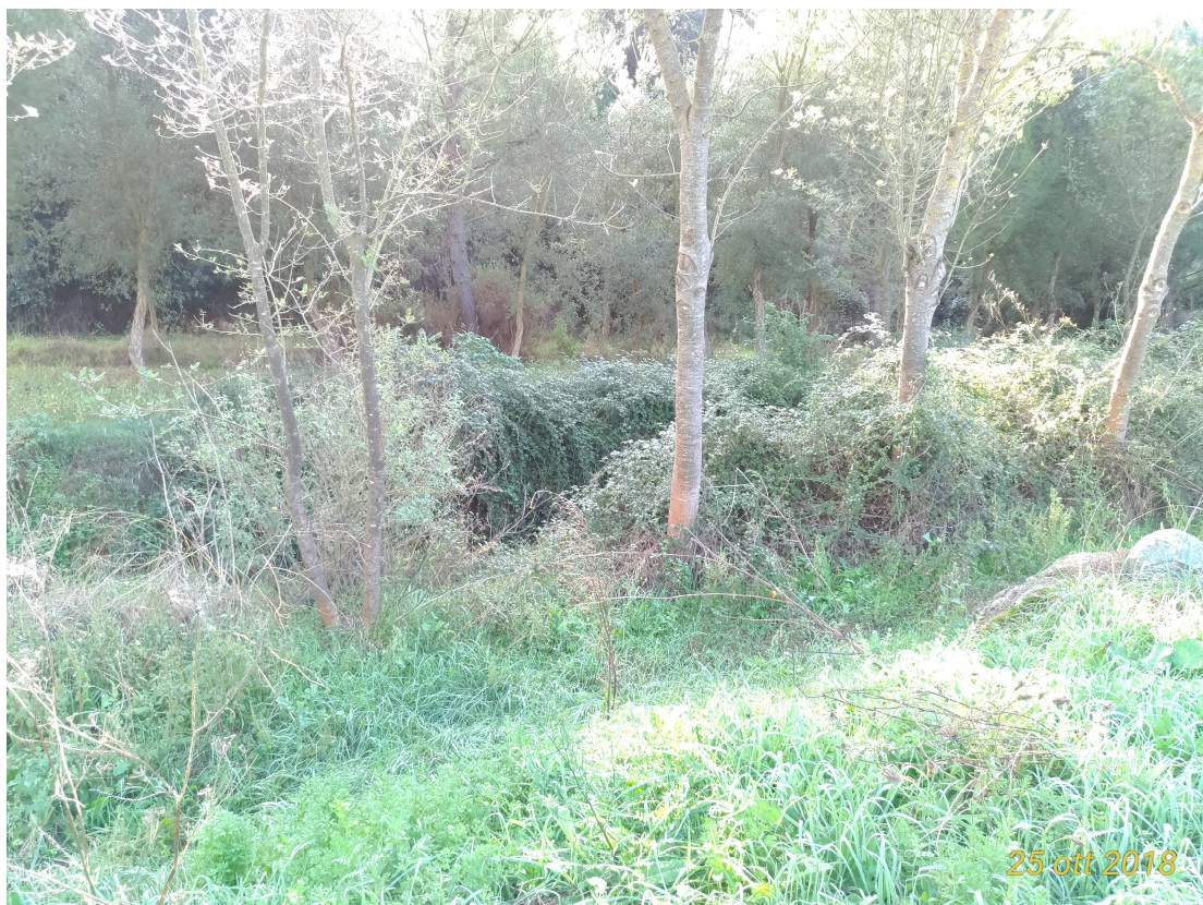
Foto 1 Rio Funtana Bella