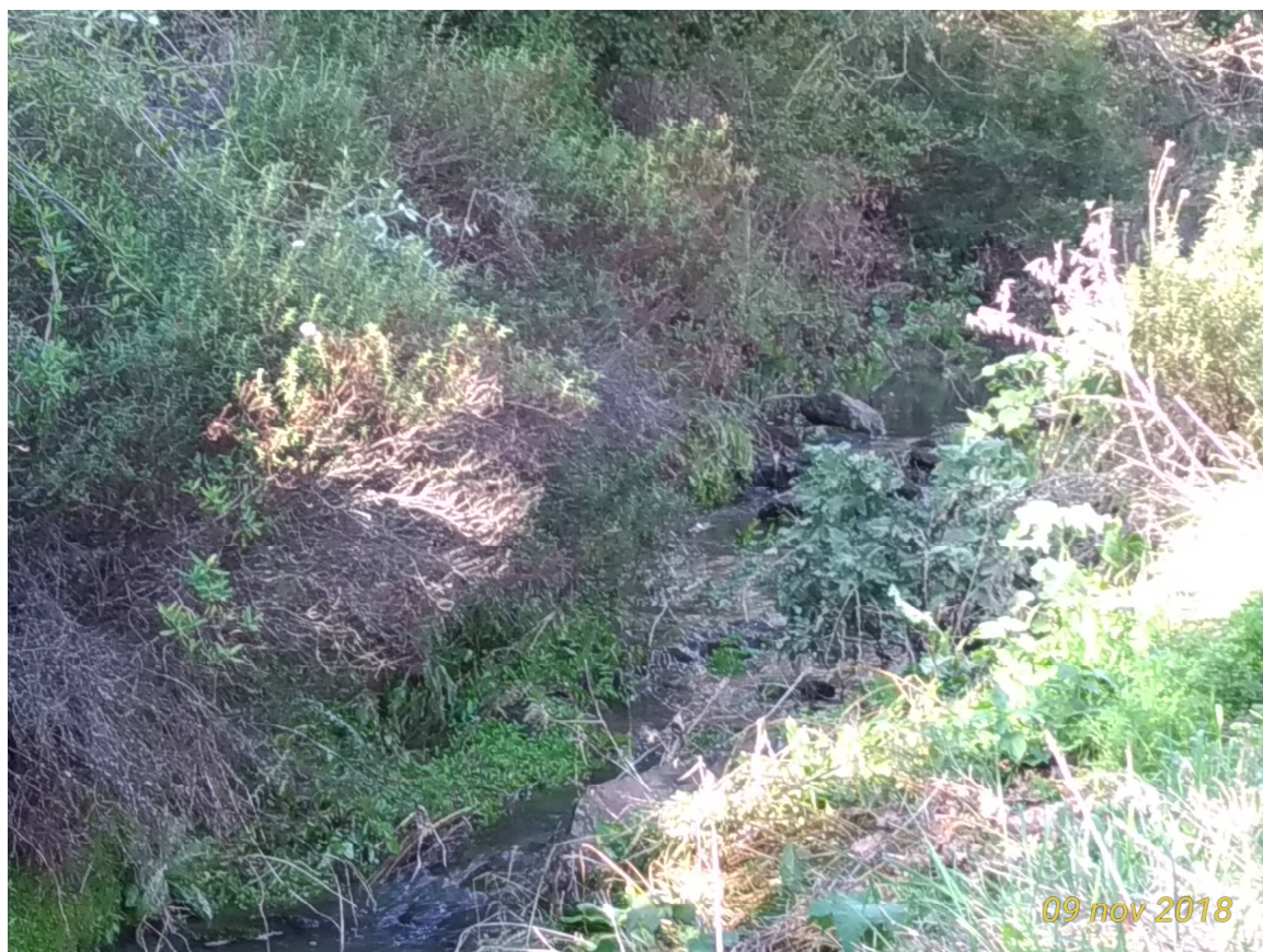
Foto 5 Rio Corrantili