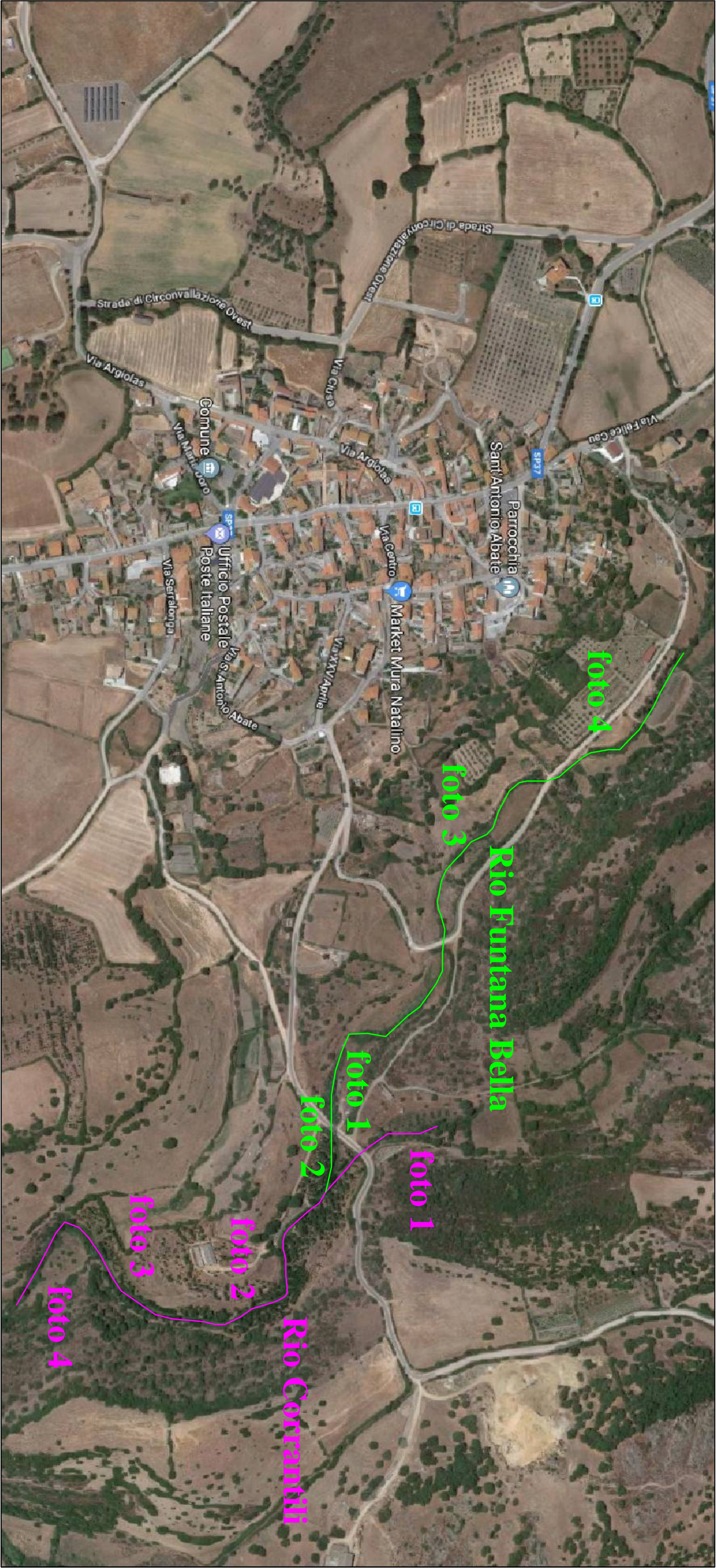
Ortofoto - Punti fotografati